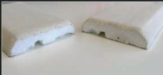
Фабричный стык (так изделие выходит со станка)

Для того, чтобы стык на детали был максимально не заметен, необходимо освежить срез стыкуемых изделий. На фото ниже представлены три вида стыка: